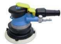
Maxima in 3, 5 und 7mm Hub