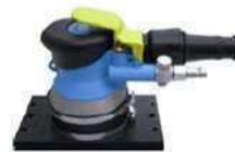
Maxima OS in 3, 5 und 7 mm Hub