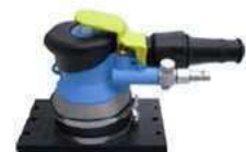
Maxima OS in 3, 5 und 7 mm Hub